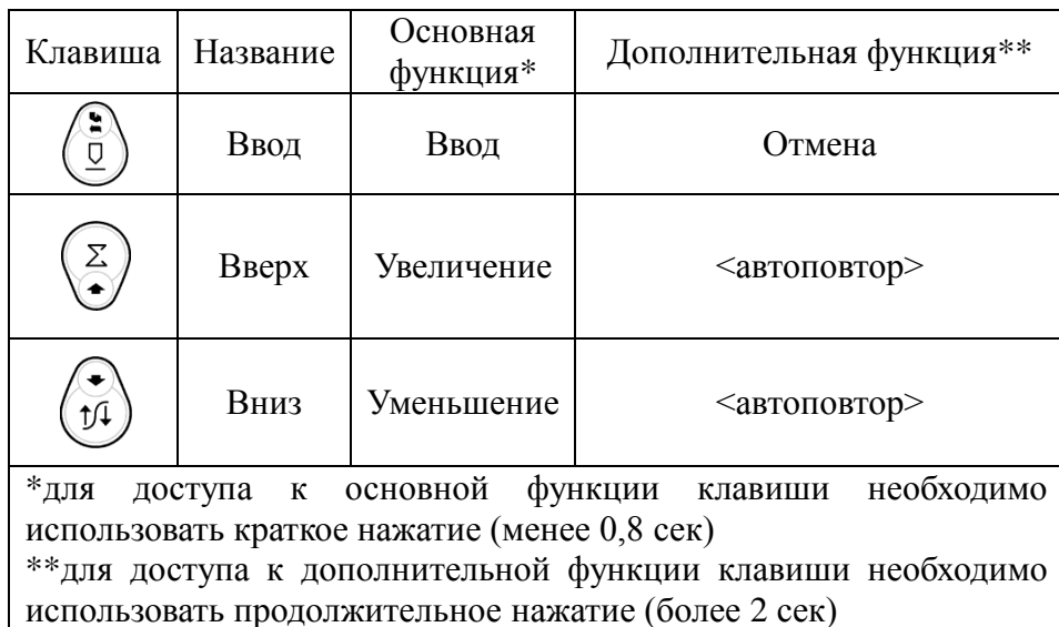
Таблица 5.2 Функции клавиш толщиномера в режиме ввода значений