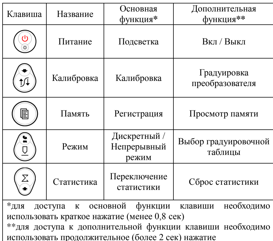
Таблица 5.1 Функции клавиш толщиномера в режиме измерения

5.8 При включении толщиномера производится автоматическая настройка измерительного тракта. При этом необходимо держать преобразователь на расстоянии не менее 10 см от ферромагнитных объектов, кроме того рекомендуется сохранять пространственную ориентацию преобразователя, используемую при дальнейшем измерении.