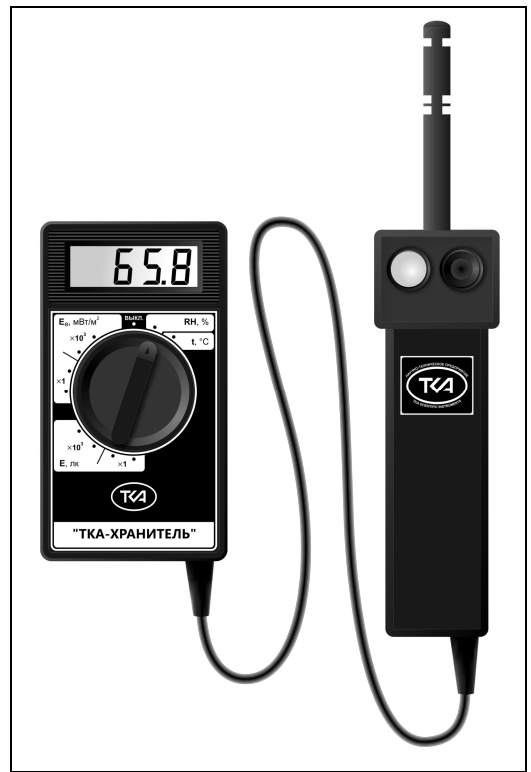
1 2 Рис. Внешний вид прибора

7.3.5. По окончании измерений установите на ТВ-зонд защитный колпачок.